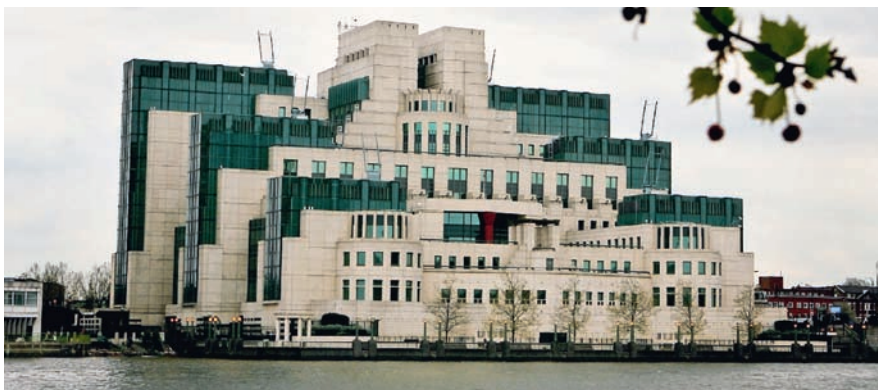
Sediul MI6 (Vauxhall Bridge, stația de metrou Vauxhall, pe Victoria Line)