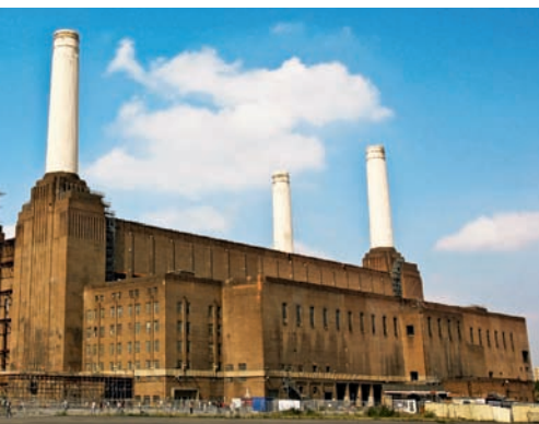
Fosta centrală electrică Battersea