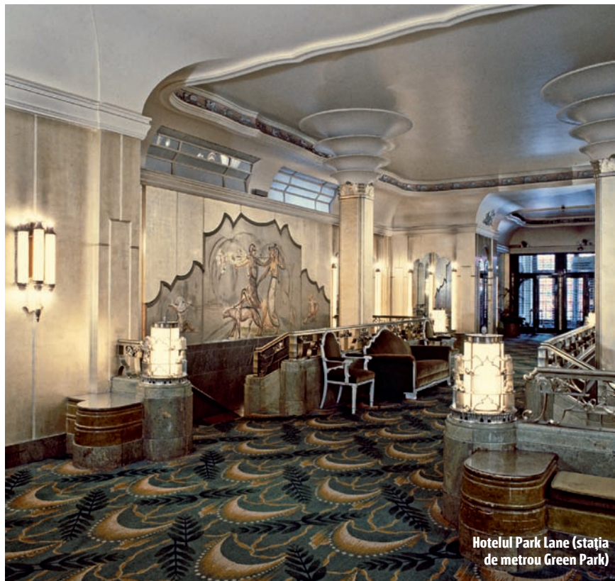
Hotelul Park Lane (stația de metrou Green Park)

P rima dată când m-am simțit ca într-un film de Metro Goldwyn Mayer de început de secol XX, mă aflu într-o prăvălie de lux de lângă Champs Élysées, cu un nume parcă predestinat: „Le Roi Fou“ (Regele Nebun). Am petrecut o oră pe un fotoliu cu spătar rotunjit, la lumina unei lămpi Lalique, prinzând, în treacăt, frânturi din conversația unui cuplu de francezi care negociau o piesă de mobilier din mahon lucios din 1930, comparabilă ca preț cu un apartament din 2010 într-un cartier rezidențial din București. (Până la urmă s-au oprit asupra unei măsuțe care costa doar cât un apartament într-un bloc de la noi din anii '70!).