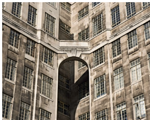
Sediul general al metroului londonez (St. James Park)