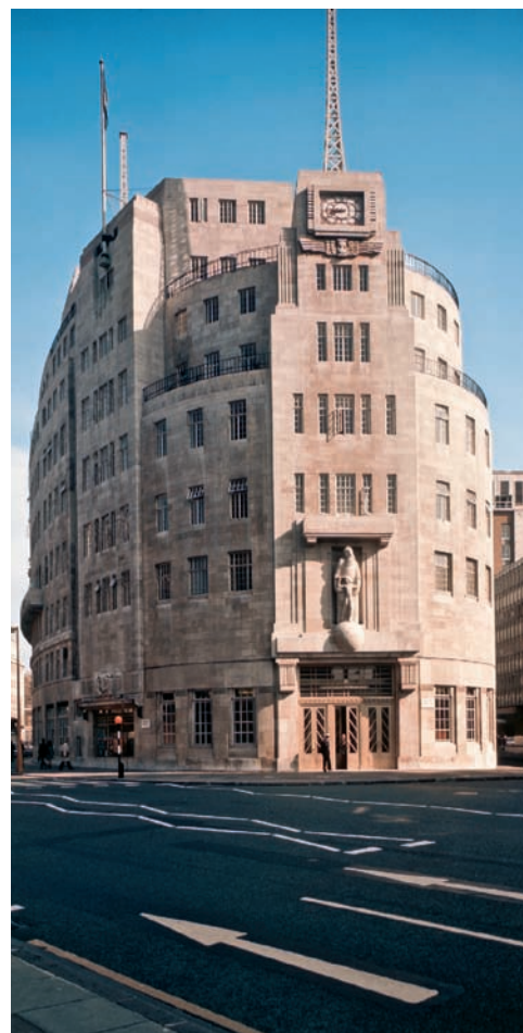
Public Broadcasting House (Oxford Circus)

Aflată în apropierea sediului MI6, lângă Vauxhall Bridge, Battersea avea, pe vremuri, un scop prea puțin artistic: încălzirea ploioasei capitale britanice. Exteriorul, cu o arhitectură Art Deco în nuanțe futuriste, atrage atenția trecătorilor, însă puțini au curiozitatea să-i afle istoria și tainele. Acum dezafectată, centrala ar merita o soartă mai bună, măcar de dragul renumitelor desene Art Deco și a marmurei cu motive geometrice din camera de control, care nu au mai văzut lumina zilei de aproape un secol. F