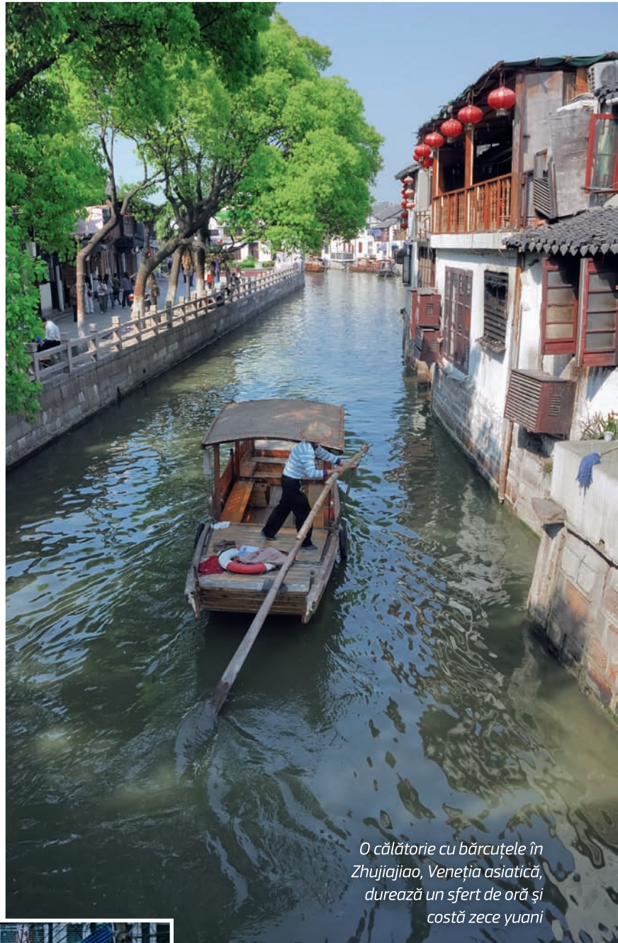
O călătorie cu bărcuțele în Zhujiajiao, Veneția asiatică, durează un sfert de oră și costă zece yuani

american - sau naturalizat - plecat într-o excursie de studii în Pattaya, se angaja, pe propria răspundere, că