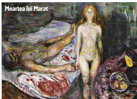
Moartea lui Marat