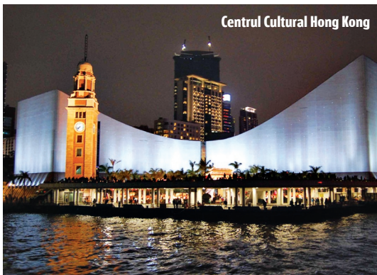
Centrul Cultural Hong Kong

curioșilor, dar și mai autentic decât orice peliculă în 3D. Ca un bonus, poți vedea și niște vedete locale în carne și oase. Centrul Cultural Hong Kong, aflat în zona Bulevardului Starurilor, este un fel de „Teatru Kodak” al Hong Kongului. Ședințe foto sau evenimente cu covor roșu și cârduri de paparazzi au loc când te aștepți mai puțin. Nimic nu influențează însă desfășurarea spectacolului, șapte zile din șapte, singura situație de forță majoră fiind avertizarea de ciclon tropical. F