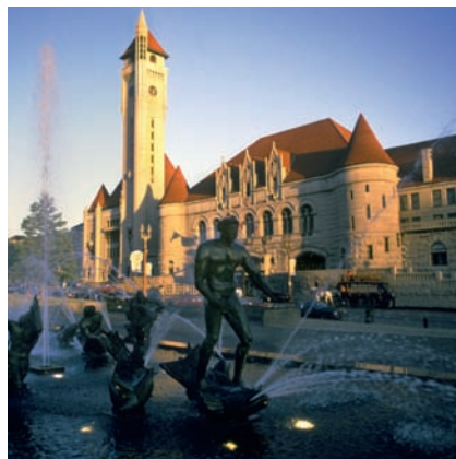
Arhitectura St. Louis Union Station este inspirată de cetatea medievală Carcassonne