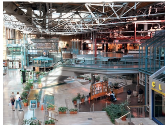
Interiorul gării adăpostește, în prezent, magazine de suveniruri, cafelele și un muzeu feroviar