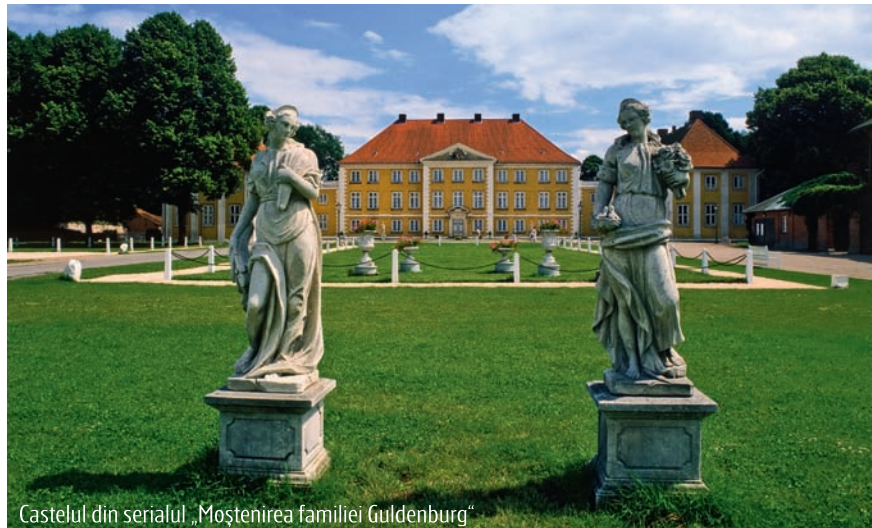
Castelul din serialul „Moștenirea familiei Guldenburg“

În orașul lui Al Capone și al filmelor despre acest gangster, vechea gară Union Station, veche de 85 de ani, este o vedetă în toată regula, fiind folosită