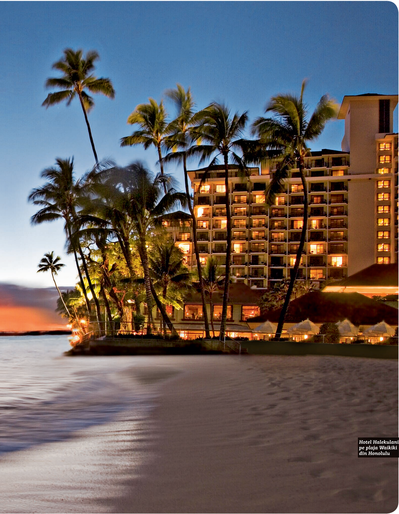
Hotel Halekulani, pe plaja Waikiki din Honolulu