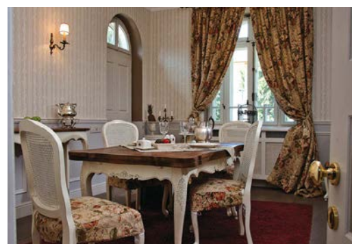
În restaurarea vilei Poem-Boem, soții Enache și-au dorit să recreeze viziunea inițială a arhitectului Toma T. Socolescu.

un alt telefon, prin care era anunțat că primul cumpărător se răzgândise, așa că vila care îi atrăsese atenția se afla din nou pe piață.